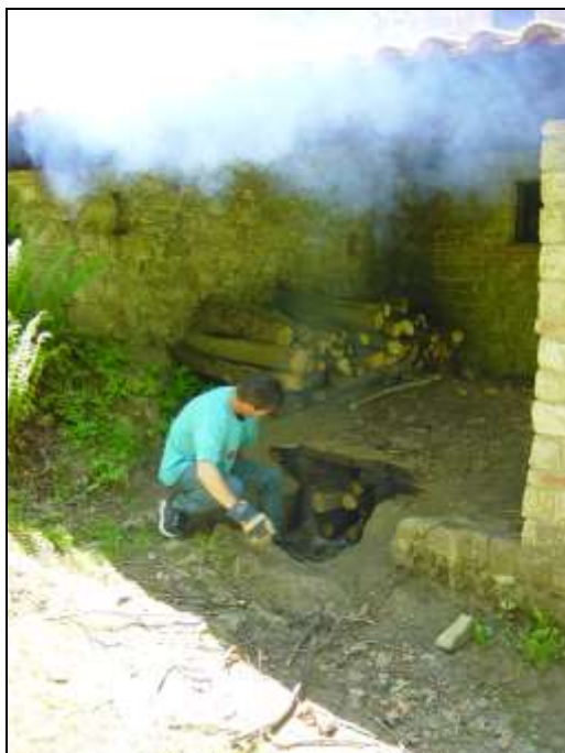
Fig. 3. Allumage du feu.