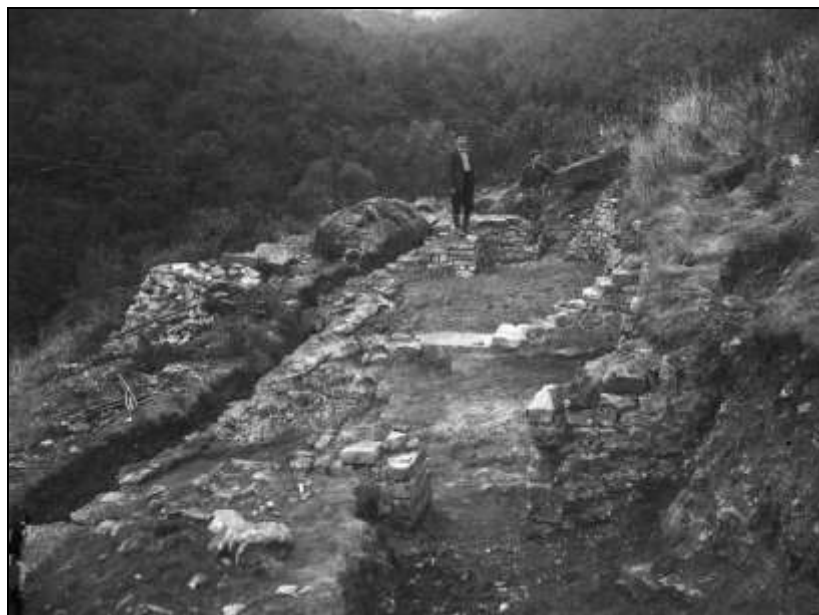
Fig.1. Les thermes en 1932. Etat avant reconstruction.

En 1932 (fig.1), J. Breuer présenta les plans d'une restitution théorique de l'édifice mais la concrétisation de cette intéressante reconstruction ne vit seulement le jour qu'en 1956 7 .