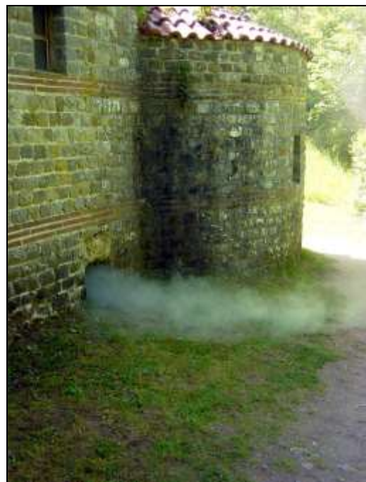
Fig. 4. Evacuation des fumées.